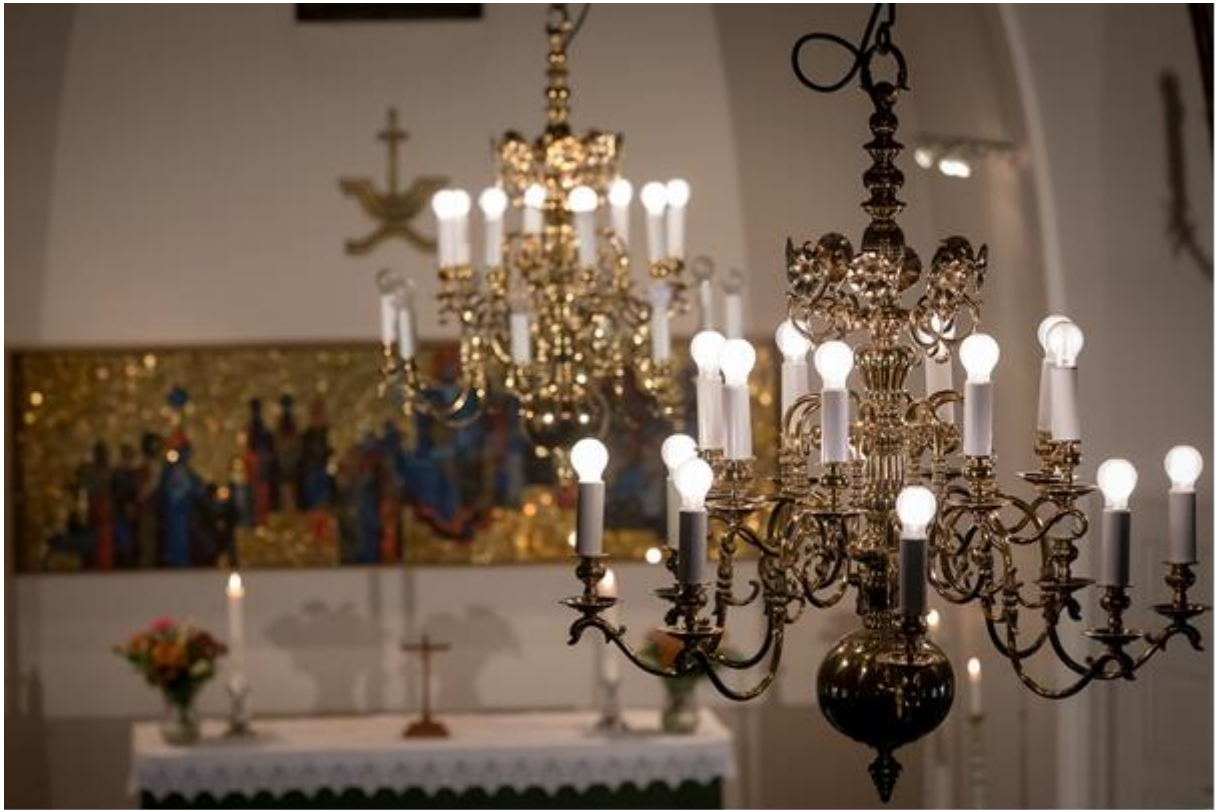
S:t Görans kyrka