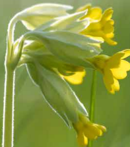
PRIMULA VERIS / GULLVIVA

Den 29 november arrangerade diakoniarbetarna och ungdomsarbetsledarna en julpysseldag där cirka 60 deltagare kunde göra miljövänliga julpysslar av t.ex. papper och tygbitar. Särskilt populärt var kranstillverkningen av kvistar från gravgården. En personal från gravgården bistod under kvällen och hade även i förväg tillverkat kranstommar av kvistar.