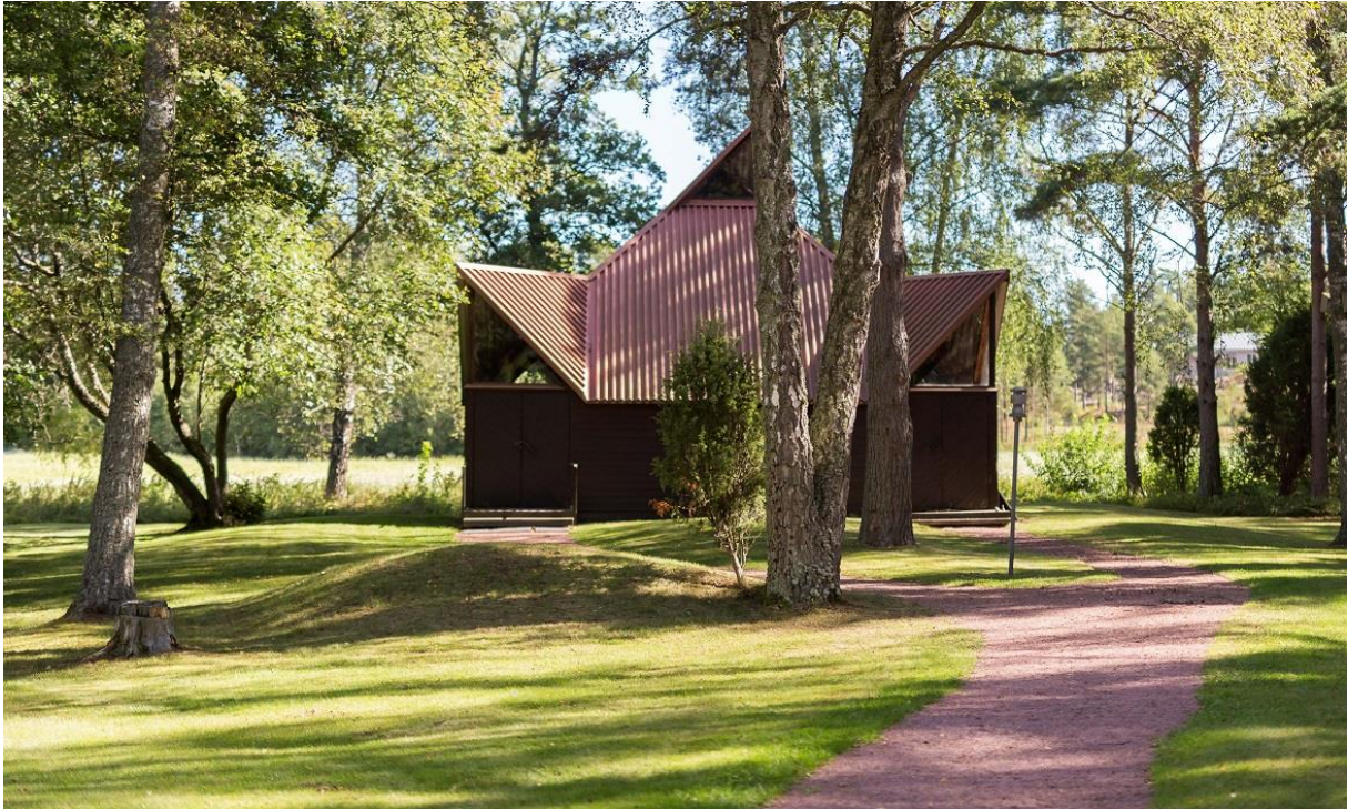
S:t Johannes kapell